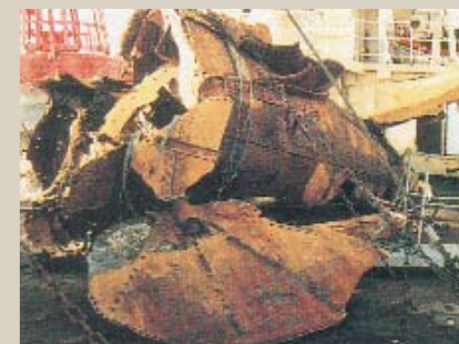
Een Urker kutter liep in 1990 vast met zijn netten op de E3 en borg een torpedobuis.

«De Britse overheid heeft in beginsel geen bezwaar tegen duiken op de E3 of andere Britse wrakken in Nederlandse wateren», schrijft Peter verder. «Maar er zijn mensenoffers gevallen door het zinken van de E3; het lijkt ons dan ook niet meer dan fatsoenlijk om zo'n plek met gepast respect te bezoeken. Het gaat uiteindelijk om de laatste rustplaats van militairen. Daarom vinden wij dat hier een 'kijken, maar niet aanraken'-beleid zou moeten gelden voor duikers. Voorwerpen zouden niet verplaatst of verwijderd moeten worden. We verzoeken eveneens het binnenste van het wrak niet te filmen en menselijke resten niet te verstoren. Mochten zulke overblijfselen toch onbedoeld gefilmd of gefotografeerd worden, dan vragen wij die resultaten niet te publiceren of verspreiden.»