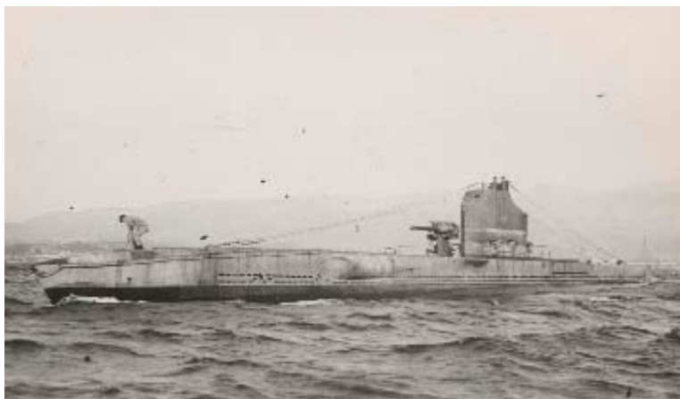
De Franse onderzeeboot Doris onderweg tijdens een operatie op de Noordzee.