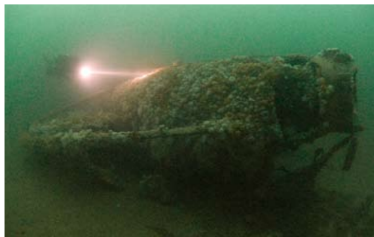
Linksboven: In 1917 gaat de E43 vanuit Harwich op weg naar een patrouillegebied in de buurt van Terschelling. Daar komt de onderzeeër in noordoosterstorm terecht en vaart hij dwars over de E36 heen. Overige foto's: Na al die jaren op de zeebodem is de volledig begroeide E36 nog altijd vrij goed herkenbaar, als een onderzeeboot.

precies gebeurd is. Het wrak heeft wel wat meer herkenbare delen dan de Doris. Hij ligt wat hoger boven het zand, de ronde vormen, de torpedo-buis en de opbouw maken dat het er echt nog uitziet als een onderzeeboot.