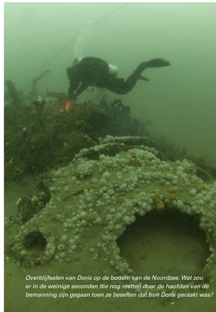
Overblijfselen van Doris op de bodem van de Noordzee. Wat zou er in de weinige seconden die nog restten door de hoofden van de bemanning zijn gegaan toen ze beseften dat hun Doris geraakt was?

door de vijand, maar in aanvaring met een andere Engelse onderzeeboot zodanig beschadigd dat dat het vroege einde van deze boot betekende. De E36 was op 19 januari 1917 evenals de E43 vanuit Harwich op weg naar een patrouillegebied in de buurt van Terschelling, toen ze 's avonds in een noordoosterstorm terecht kwamen. Door de hoge golven en het slechte zicht kon de E43 niet voorkomen dat hij dwars over de E36 heen voer. Doordat er vanaf dat moment niets meer van de E36 is gehoord, is niet duidelijk wat er