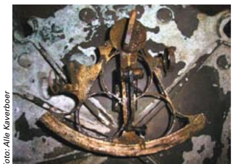
Recent geborgen uit de E3, een sextant.