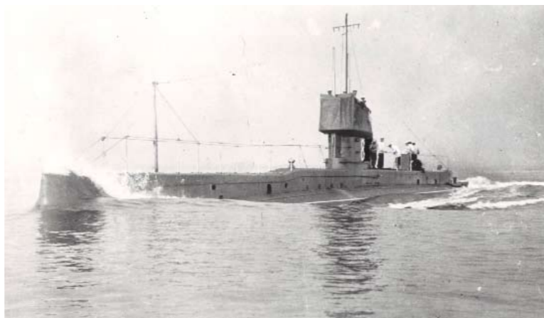
E-3, de eerste onderzeeër die door een andere duikboot tot zinken werd gebracht.