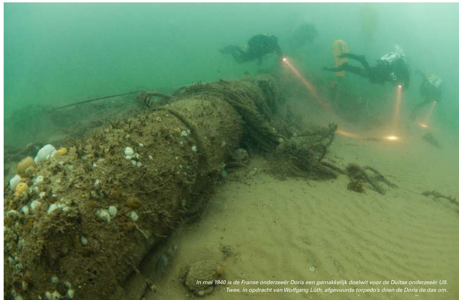
In mei 1940 is de Franse onderzeeër Doris een gemakkelijk doelwit voor de Duitse onderzeeër U9. Twee, in opdracht van Wolfgang Lüth, afgevuurde torpedo's doen de Doris de das om.

Niet alle onderzeeërs hebben een zo tot de verbeelding sprekend verhaal. De ochtend van diezelfde dag hebben we op een nabijgelegen Engelse onderzeeër gedoken, de E36, gezonken in de Eerste Wereldoorlog. Niet getorpedeerd